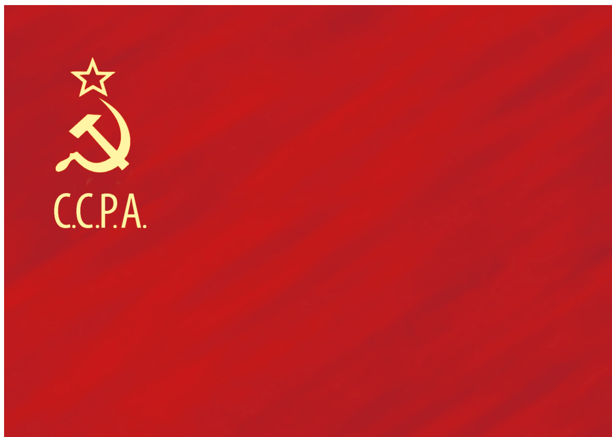
Флаг ССР Абхазии (1925–1927 гг.)